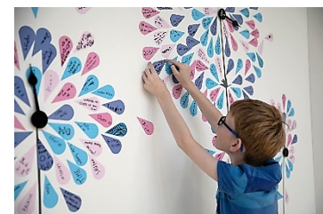
展示作品イメージ

回転速度が異なる時計の針の周りに、来場者によって書かれた時間についてのさまざまなアイデアの花びらが置かれていきます。来場者によって作られた時間の花は、人それぞれで異なる時間や、状況によって伸び縮みする時間に対する感覚を明らかにするでしょう。