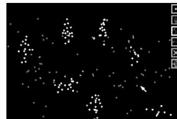
展示作品イメージ

体験者によって空間に置かれた点群から人や犬、鳥、地面などが浮かび上がって動き出す作品です。配置された点の位置関係により、点から生まれた形は、自動的に生成、消滅、変身、変形を繰り返します。