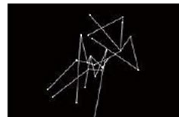
展示作品イメージ

点の集合から仮想生命が生まれる作品です。画面上に 24 個の点があります。視点の位置から左右対称でバランスの取れた骨格が見つげ出され、仮想生命が生成されます。24 秒間の寿命が尽きると通常の点に戻り、また別の骨格をもった仮想生命が生まれます。体験者の操作で視点が変わると、点の位置が変わり、生命の姿も変化します。