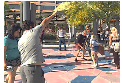
展示作品イメージ

公共の広場に知らない人同士の共通体験を作り出す作品です。地面に置かれたパネルの上に影が落ちると、録音した人の声から作られたさまざまな音が鳴り出します。鑑賞者は互いの影を作り出す音によってセッションをしたり、一期一会で生み出される非日常的な体験をほかの人と共有することができます。