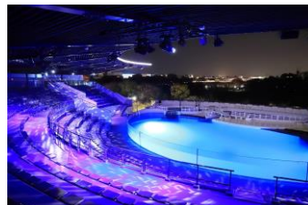
「イルカスタジアム」