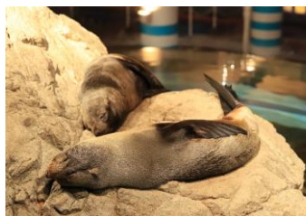
オットセイが寝ているようす