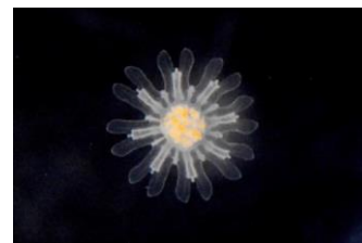
ミズクラゲのエフィラ