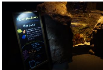
夜のいきもの解説黒板