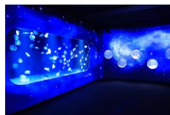
「くらげ」エリアの映像演出