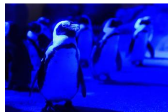
青い照明につつまれるペンギン