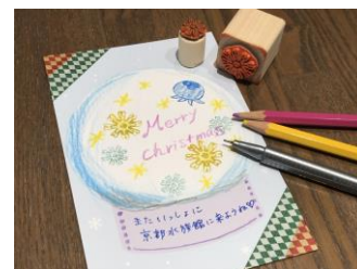
オリジナルのクラゲカード