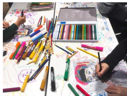
過去のワークショップフェス開催の様子

「ナレッジキャピタル ワークショップフェス」は、2013年の開業時よりナレッジキャピタルに参画する大学や企業のプログラムを活用して、“子どもたちにとってナレッジキャピタルが家庭や学校以外の第三の学びの場となること”を目的に年3回（春・夏・秋）開催しています。