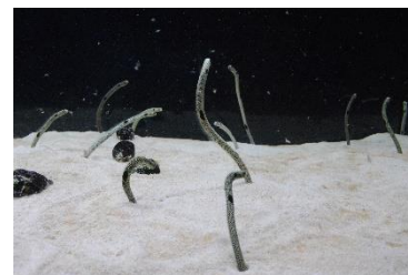
ごはんを食べるチンアナゴ