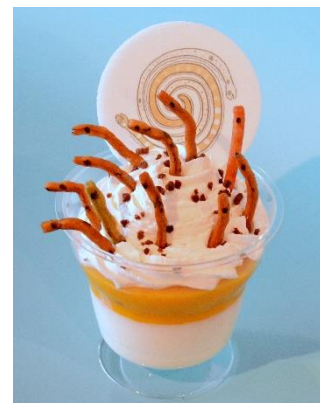
「ちんあなごだらけパフェ」

砂から顔を出す11匹のチンアナゴをモチーフとした期間限定のオリジナルパフェを販売します。昨年初めて販売し、期間中毎日完売した大好評のメニューが期間限定で再登場します。今年はイラストレーターのぬまがさわり氏が書き下ろしたイラストをライスプレートにプリントしています。