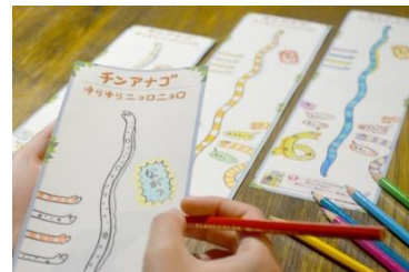
「長いチンアナゴのぬりえ&クイズ」

「ぬまがさわりの ゆかいないいきもの㊦図鑑」の著者であるイラストレーターのぬまがさわり氏が書き下ろした約30センチの等身大チンアナゴのぬりえワークショップを実施します。