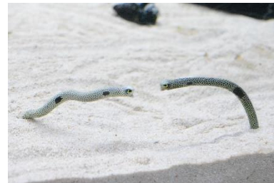
喧嘩するチンアナゴ