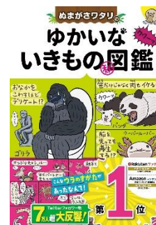
『ぬまがさわりの ゆかいないいきもの㊦図鑑』(西東社)

面白いいきもの(と面白い映画)を愛するゆかいなイラストレーター。2016年から突然WEBでふしぎな生きもの図解イラストを発表し始め、ツイッターフォロワー数約7万人超えの大反響をよんでいる。『ぬまがさわりの ゆかいないいきもの㊦図鑑』(西東社)などを刊行し、好評発売中!