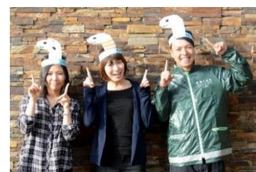
「なりきりちんあなご」