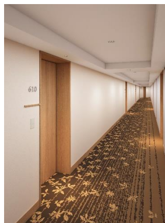
本館客室廊下 イメージ