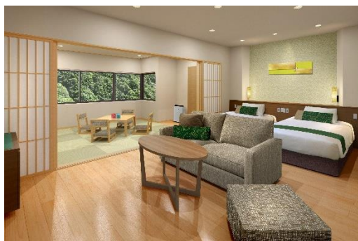
別館和洋室 イメージ

本館共用スペースはデザインに宇奈月の山野草をモチーフに取り入れ、より一層、北陸の魅力を感じていただける施設を目指します。