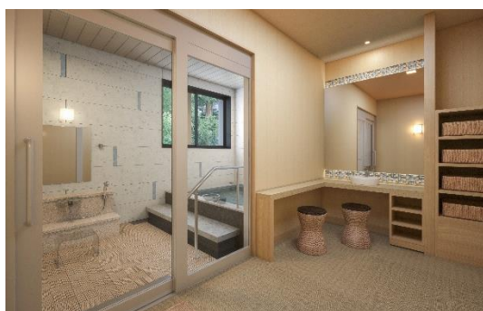
貸切風呂 イメージ