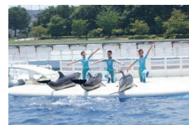
イルカトレーナー