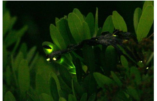
ヘイケボタルの発光

すみだステージで小さなボトルに入ったホタルを展示します。夜の水族館でラグに座ってゆったりとリラックスしながら、柔らかな光を放つホタルを自分の手元で間近に眺めることができます。