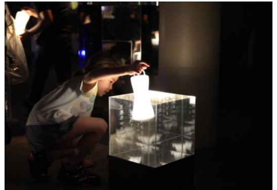
「ほたる語り」イメージ

開催内容：ランタンをミラーボックスに入れると、ホタルの特徴を詩にした「ホタルからのメッセージ」が浮かび上がり、ホタルの生態について楽しく学ぶことができます。