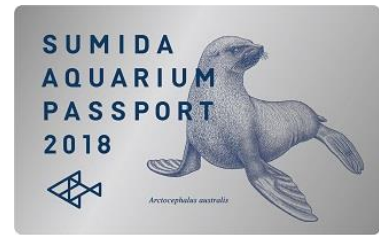
すみだ水族館 年間パスポート