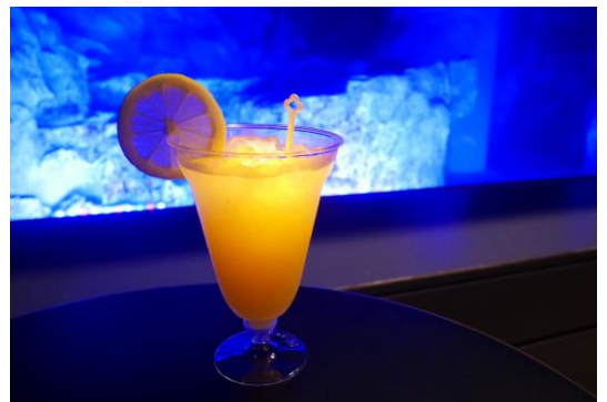
「ほたるのひかりカクテル」

※アルコールの入っていない「ほたるのひかりジュース」(税込み600円)も販売いたします。