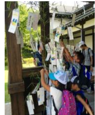
笹に願いごとをイメージ

設置日時：2018年8月4日(土)、5日(日) 設置箇所：京都水族館、京都鉄道博物館、中央広場(※)、市電カフェ、市電ショップ、梅小路パークカフェ、緑の館 ※中央広場のみ11日(土・祝)、12日(日)も設置