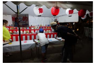
ミニ縁日イメージ

開催日：2018年8月4日(土) 開催時間：17時00分～20時30分 点灯イベント(点灯時間) 19時15分頃～ 開催場所：芝生広場 野外ステージ付近 対象及び定員：親子(小学生までのお子さま)先着100組 ※1組1セット 申込方法：①参加人数(大人・子どもの各人数) ②代表者の氏名 ③電話番号 ④メールアドレスを記載し、7月25日(水)までに 下記のメールアドレス宛に申込 申込先：umekouji.tourou@gmail.com