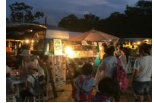
キッチンカーイメージ

開催日時：2018年8月4日(土)、5日(日)、11日(土・祝)、12日(日) 14時00分～21時00分 開催場所：中央広場