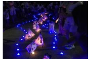
オリジナル行灯点灯イメージ