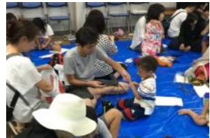
行灯をつくろう！イメージ