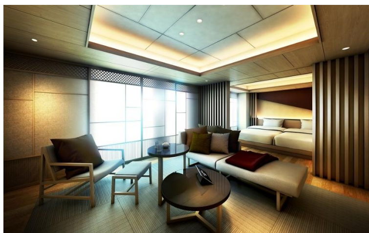
和スイート（70㎡）イメージ

オリックス不動産株式会社（本社：東京都港区、社長：高橋 豊典）は、2018年6月25日（月）正午より、「クロスホテル京都」（所在地：京都市中京区）の予約受付を公式ウェブサイトを開始しますのでお知らせします。当ホテルの開業は本年秋を予定しています。