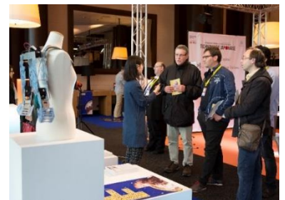
「バン・ニューメリック 2016」出展の様子

ナレッジキャピタルは、2015年9月にCDAとMOU(相互連携に関する覚書)をフランスにて締結し、相互訪問を重ねるなど継続的なリレーションシップを構築しています。このたび、CDAより前回の開催に続き正式招待を受け、2開催連続の出展が実現しました。