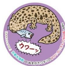
オリジナルステッカー (オオサンショウウオ)

「ぬまがさわたりの ゆかいないきもの㊦図鑑」「図解 なんかにへんな生きもの」の著者であるぬまがさわたり氏と初めてのコラボレーション企画展を開催します。さまざまな種類のオオサンショウウオの仲間の両生類を展示し、描き下ろしイラストで解説します。不思議でインパクトあるオオサンショウウオの仲間たちの世界を存分に楽しむことができます。ほかにも、オリジナルのフォトブースでは、写真を撮ってハッシュタグで SNS に投稿いただくと、枚数限定で「京都水族館×ゆかいないきもの㊦図鑑」オリジナルステッカーをプレゼントします。