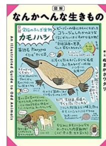
「図解 なんかにへんな生きもの」 (光文社)