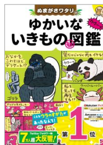
「ぬまがさわたりのゆかいな いきもの㊦図鑑」(西東社)

面白いいきもの(と面白い映画)を愛するゆかいなイラストレーター。2016年から突然WEBでふしぎな生きもの図解イラストを発表し始め、ツイッターフォロワー数約7万人超えの大反響をよんでいる。このたび、子ども向けのオール描き下ろし『ぬまがさわたりの ゆかいないきもの㊦図鑑』(西東社)を刊行。『図解 なんかにへんな生きもの』(光文社)とともに好評発売中!