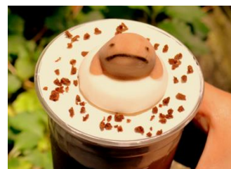
オオサンショウウオのマシュマロがひよっこり!