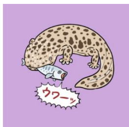
オオサンショウウオの描き下ろしイラスト