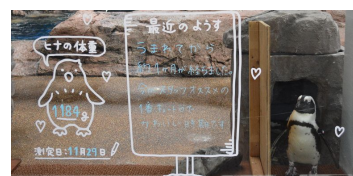
「ペンギンの赤ちゃん成長日誌」イメージ

赤ちゃんの誕生から成長を見守る飼育スタッフが、赤ちゃんのようすなど日ごろの想いを込めて書いた「成長日誌」を展示エリアに掲示します。