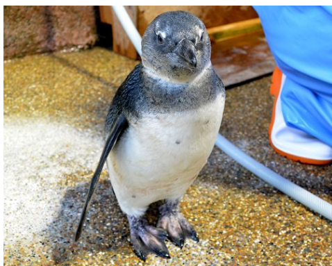
現在の「ケーブペンギン」の子ども