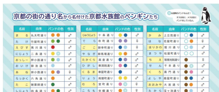
ペンギン名前シートイメージ

3月9日(金)～3月31日(土)の期間、来館者全員に京都水族館で暮らすペンギン全羽の名前がわかる「ペンギン名前シート」を配布します。名前を覚えながらペンギンたちのようすを観察することができます。