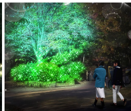
C 「星のささやき」(イメージ)