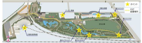
『Starlight Accessories～星屑のアクセサリー～』イベントマップ

梅小路公園内の4カ所で、「Starlight Accessories～星屑のアクセサリー～」をテーマに緑の中に星屑が舞い散るように約3万球の光で演出する幻想的なライトアップイベントを行います。ライトアップエリアを結ぶ沿道には行灯(あんどん)を約300基設置し、梅小路公園全体をやさしい光で包みます。期間中は公園内の各施設でも特別に営業時間の延長やライトアップなどを行い、イベントを盛り上げます。