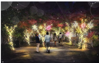
A 「星のイヤリング」(イメージ)