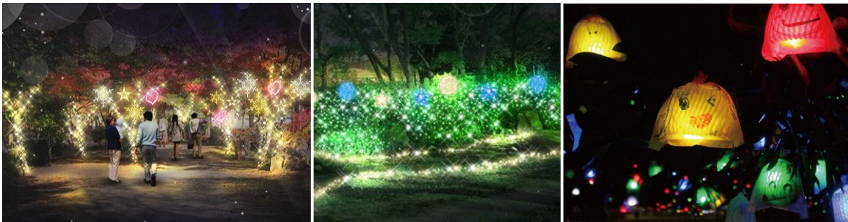
「京都・冬の光宴2018 Starlight Accessories～星屑のアクセサリー～」(イメージ)

京都・梅小路みんながつながるプロジェクトは、梅小路公園において冬のライトアップイベント『京都・冬の光宴2018 Starlight Accessories～星屑のアクセサリー～』を2018年2月2日(金)～2月14日(水)の期間に開催しますのでお知らせします。