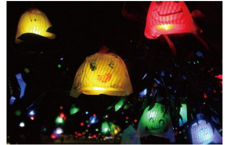
「ひかりの実」点灯イメージ

開催日 : 2018年2月3日(土) 開催時間 : 13時00分～16時00分 ワークショップ開催 18時00分 完成 ※点灯は順次、準備数に達し次第終了 参加方法 : 当日受付 料金 : 無料 場所 : 梅小路公園「芝生広場」ステージ ほか