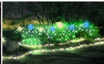
B 「星のせせらぎ」(イメージ)