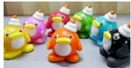
「ペンギンガム お正月バージョン」