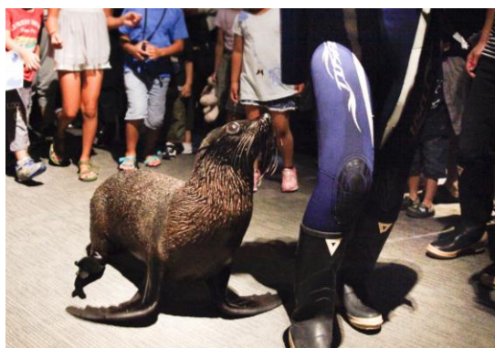
犬のなかまであるオットセイによるごあいさつ