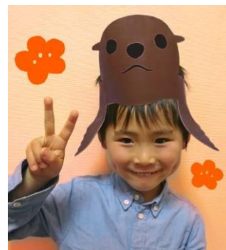
オットセイのお面 イメージ