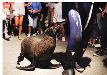
「お正月！オットセイパレード」イメージ

※参加者は、14時10分に館内インフォメーションに集合いただき、体験プログラム「お面でオット！福笑い」でお面を作った後、飼育スタッフ・オットセイと一緒に館内を歩いていただきます。