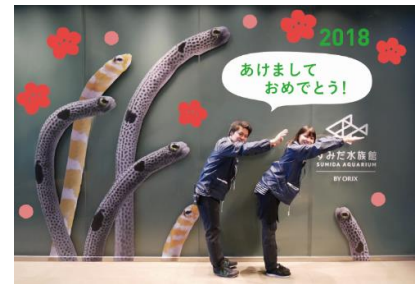
「チンアナゴウォール お正月バージョン」イメージ

設置内容：戌年にちなんで、犬の「狎(ちん)」が名前の由来であるチンアナゴのフотスポットを設置します。新年の水族館に来館いただいた記念写真を、ポーズを工夫して楽しみながら撮ることができるフотスポットです。