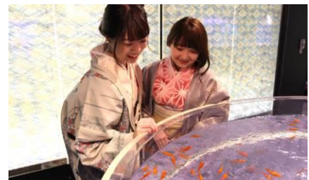
和の空間「江戸リウム」はおすすめのフотスポット