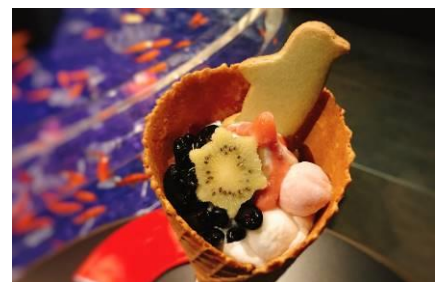
「ペンギン和ッフルソフト お正月バージョン」

販売内容：塩バニラ味のソフトクリームに、ペンギンのクッキー、黒豆、紅白の白玉、縁起がいいとされるカメの形のキウイ、ストロベリーソースをトッピングした、可愛いデザートです。