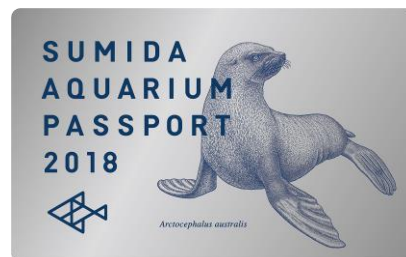
年間パスポート 2018年新デザイン

販売内容：2018年新デザインのすみだ水族館年間パスポートを販売します。戌年にちなんで、券面も犬のなかまであるオットセイのデザインになっています。