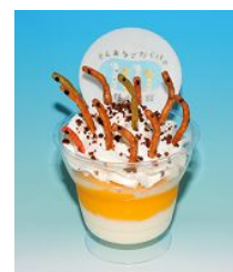
「ちんあなごだらけパフェ」