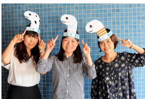
みんなでチンアナゴになりきろう！

チンアナゴになりきることができるお面を2日間限定で来館者に配布します。お面は好きな模様や色を塗ってオリジナルのお面を作ることができます。