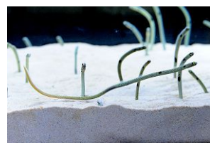
チンアナゴをじっくり観察できます

展示期間：2017年11月1日(水)～11月30日(木) 展示場所：「京の海」2階 料 金：無料(別途水族館への入場料が必要)