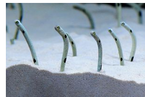
チンアナゴ展示イメージ

展示期間：2017年11月1日(水)～11月30日(木) 展示場所：「京の海」2階、「交流プラザ」、「交流プラザ」入口 料 金：無料(別途水族館への入場料が必要)