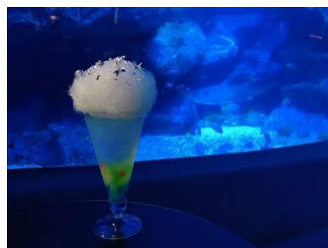
Fairy tale ソーダ

販売内容：クラゲのような綿あめが乗ったオリジナルソーダです。刺繍アートで使われている色とりどりのスパンコールやビーズをイメージしたカラフルなゼリーのボールが、梨のソーダに入っています。