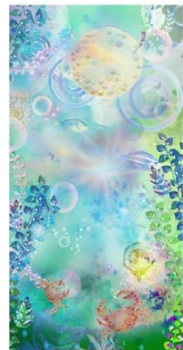
「蟹の親子と輝く泡」イメージ

展示内容：「やまなし」の物語をイメージした高さ約7メートルの映像が投影され、きらきらと光が差し込む水面を水の底から見上げるような体験ができます。蟹の親子と優しい光、いくつもの輝く泡の世界が迎えます。本映像は清川あさみ氏によって今回のイベントのために新たに制作されたオリジナル作品です。