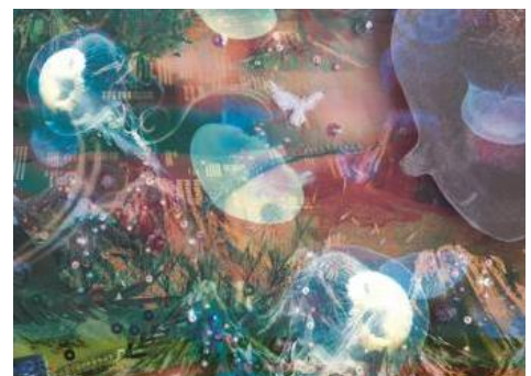
「クラゲの森」イメージ

展示内容：「グスコブドリの伝記」は宮沢賢治の代表的な童話のひとつであり、生前発表された数少ない童話のひとつでもあります。作品の中でブドリとネリが暮らした色彩豊かなイーハトーヴの森を、クラゲたちが幻想的に浮遊します。