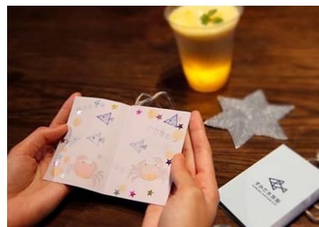
手のひら絵本づくり

開催内容：手のひらサイズの可愛らしい自分だけの童話絵本を作れます。想像を膨らませて、空いているページに色をぬったり文章を書いたりして、オリジナルのミニ絵本を完成させましょう。