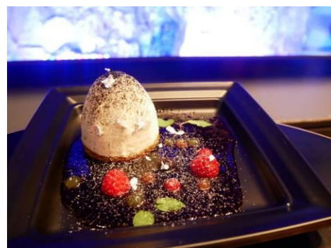
銀河系スイーツプレート

販売内容：銀河を漂うクラゲをイメージした期間限定のオリジナルメニューです。白いクラゲのようにふわふわとしたモンブランが、星くずを散りばめた銀河のような美しいベリーソースに浮かびます。