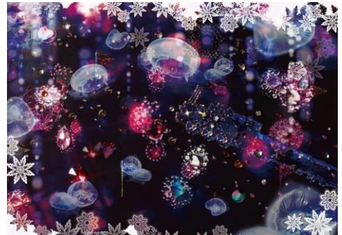
「銀河鉄道でわたる天の川トンネル」映像イメージ

展示内容：「銀河鉄道の夜」より、銀河鉄道でわたる天の川をイメージしたトンネルの体感型展示です。水晶やトパーズの河原、りんごと薔薇の匂いがする風、きらきら燃えとうもろこしの地平線など、宮沢賢治が言葉で描いた情景を清川あさみ氏によるイメージで映像化し投影します。約50メートルの鏡張りの空間で、宇宙を漂うクラゲたちを眺めながら美しい銀河のトンネルをくぐり抜けます。