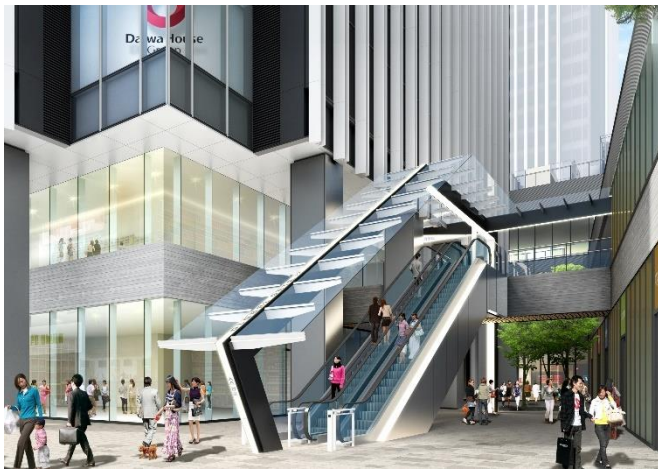
建物東側入口のウェルカムプラザのイメージ

また、東区泉にある食品のセレクトショップ「ナゴヤキッチン エ ビオ グローバルゲート」が、名古屋で人気の「Amelie（アメリ）」と「TRUNK COFFEE STAND（トランク コーヒー スタンド）」と共にグロッサリー&カフェを出店します。その他にも明治21年創業、西尾市の抹茶の老舗「あいや」が運営する抹茶スイーツの専門店「西条園抹茶カフェ」、グローバルゲート限定メニューも豊富なハワイで人気の「Yummy（ヤミー）」など、テイクアウト・イートインにもご利用いただける、さまざまなニーズに合わせた飲食店と、ゴルフ・スポーツサイクル・アウトドアショップから構成されます。名古屋初出店となるオフィスワーカーのライフスタイルに対応した新しいコンビニエンスストア「ファミマ!!」やドラッグストアに加え、トヨタ自動車による運転の魅力を発信するスポットなど、利便性を高めながら、地域カルチャーの発信と「都心生活者が求める上質な生活シーン」を提供します。