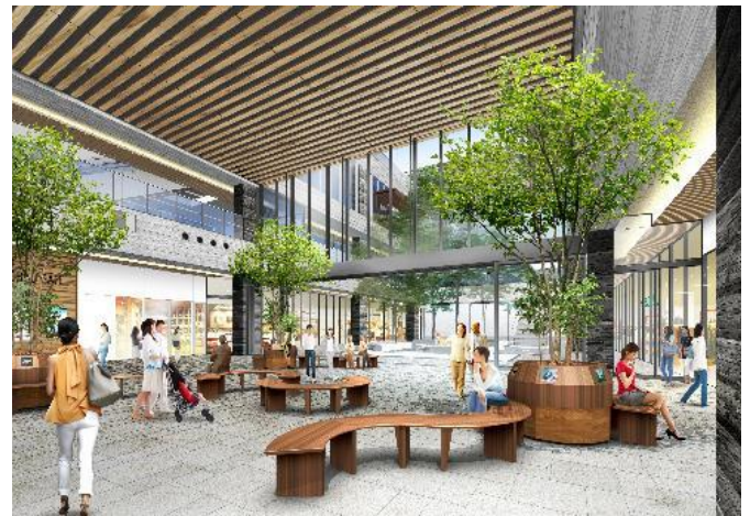
パブリックスペースとなるアトリウムイメージ