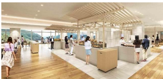
ブッフェレストラン「 とき 季しかり」

【 しかり しかり】しかりは、自然の「然」をひらがなにしたもの。その土地の自然の恵みを生かした料理を提供すること、提供側の思いや、料理に納得していただき、「そのとおりだ＝然り」と感じていただく事を表現しています。