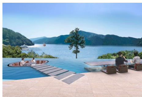
「箱根・芦ノ湖 はなをり」 ※イメージ 芦ノ湖を一望する水盤テラス、足湯カウンター

これまで培ったノウハウを結集して、このたび日本有数の温泉地である箱根にオリックスグループ初の新築旅館である『箱根・芦ノ湖 はなをり』を開業いたします。一から旅館の開発を行なうことで、お客さまのニーズやライフスタイルに合わせた施設の実現を目指します。ホテルのような快適さと和風旅館ならではのくつろぎ、心地よいおもてなしを提供する旅館がこの夏、誕生します。