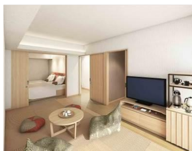
露天風呂付き和洋室 (客室)