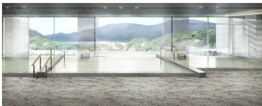
四季の露天風呂 棚湯 (芦ノ湖ビュー)