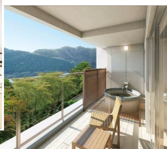
露天風呂付き和洋室 (露天風呂)