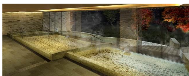
四季の露天風呂 棚湯 (庭園ビュー)