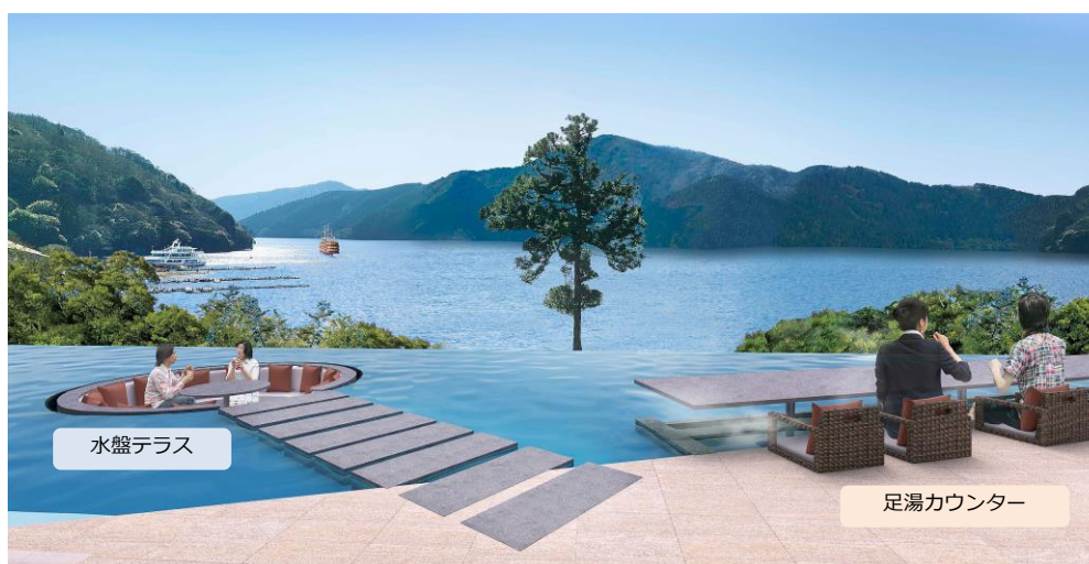
ロビーから続く水盤テラス、足湯カウンターから芦ノ湖を一望できます。

ロビーから続くオープンエアのパブリックスペースに、水盤テラスと足湯カウンターを設けました。森林の澄んだ空気、小鳥のさえずり、風の感触を楽しみながら、芦ノ湖の眺望を眼前にくつろぎのひとときをお過ごしいただけます。水盤テラスでは水を張った空間の中に円形のソファを設置し、芦ノ湖に浮かんでいるかのような感覚を楽しめます。足湯カウンターで、飲み物を手に心地よい湯のぬくもりに身をゆだねれば、身も心もリラックスできます。