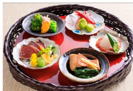
小籠に盛った料理