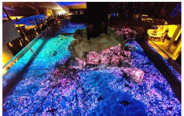
プロジェクションマッピング「ペンギンピクニック」

クラゲ展示ゾーンでは、穏やかにうねる春の海をイメージした波の揺らぎに、春の風物詩である桜などをあしらった特別映像をクラゲの水槽内へ投影する「クラゲと桜」が登場します。大型のクラゲ水槽2槽をゆっくりと移り変わる映像は、多くの生命を育みながらゆったりと波打つ春の海を想起させます。桜色に染まってふわふわと漂うクラゲたちと共に、『すみだ水族館』にやって来た春を感じられる特別演出です。