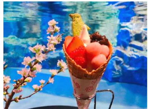
「ペンギンさくら和ツフルソフト」

販売期間：2017年3月15日(水)～5月7日(日) 販売時間：終日 販売場所：5階 ペンギンカフェ 販売価格：500円(税込) 販売内容：塩バニラ味のソフトクリームに、抹茶味の可愛いペンギンクッキーと桜色の白玉をトッピングしたワッフルソフトです。