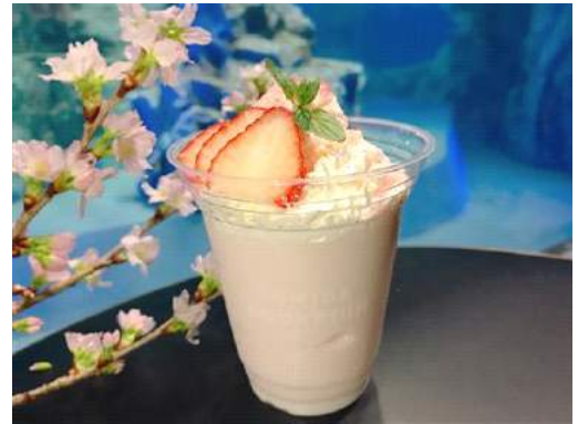
「さくらスムージー」

販売期間：2017年3月15日(水)～5月7日(日) 販売時間：終日 販売場所：5階 ペンギンカフェ 販売価格：500円(税込) 販売内容：ほんのり桜が香る春にぴったりの桜味のスムージーです。イチゴと生クリームがトッピングされ、見た目も春らしいドリンクです。