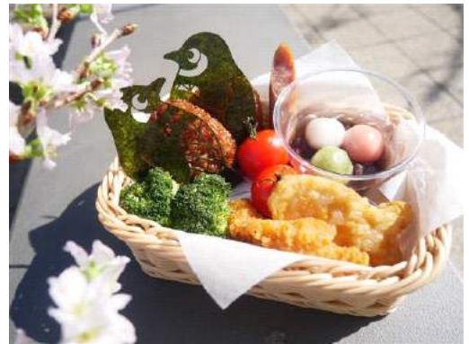
「ペンギンピクニック BOX」

販売期間：2017年3月15日(水)～5月7日(日) 販売時間：終日 販売場所：5階 ペンギンカフェ 販売価格：単品 750円(税込) ドリンク付き 850円(税込) 販売内容：オリジナルのペンギン海苔を巻いた焼おにぎりや、魚の形をしたかまぼこなど、ワクワクするピクニック気分を味わえるメニューです。デザートは3色白玉ぜんざいも付いて、見た目もおなかも大満足の一品になりました。