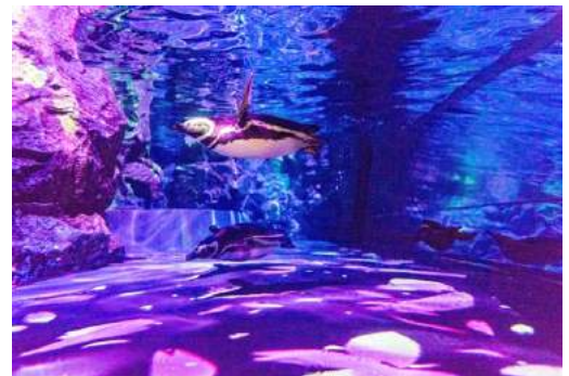
「ペンギンピクニック」(5階から見た様子)