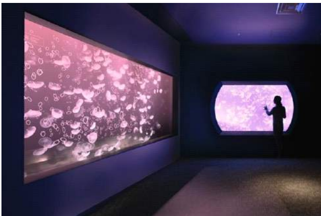
クラゲ水槽が桜色に！「クラゲと桜」（イメージ）

穏やかな春の海を思わせる水槽で元気いっぱい泳ぎまわるいきものたちを眺めながら、こころはずむ春を満喫してください。