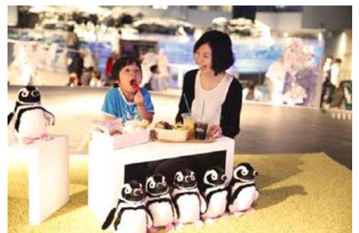
「ペンギンハナミテラス」イメージ