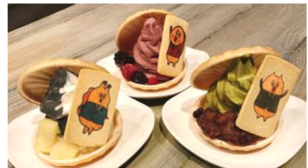
左から「もな貝社員 アサリ(塩バニラ)」「もな貝社員 ハイ貝(イチゴ)」「もな貝社員 カモ貝(抹茶)」

販売内容：貝殻の形のもなかに、「朝だよ！貝社員」のキャラクターの絵柄のクッキーとソフトクリームを挟んだオリジナルメニューです。アサリ(塩バニラ味)、ハイ貝(イチゴ味)、カモ貝(抹茶味)の全3種を販売します。