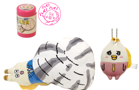
「朝だよ！貝社員」グッズ