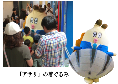
「アサリ」の着ぐるみ

展示内容：人気の「朝だよ！貝社員」キャラクター「アサリ」の着ぐるみグリーティングを開催します。すみだ水族館館内で“アッサリ”と登場し、“アッサリ”と貝殻を取ったりします。