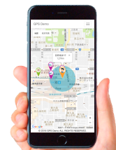
京都・梅小路エリアNAVI (※画像はイメージです。)