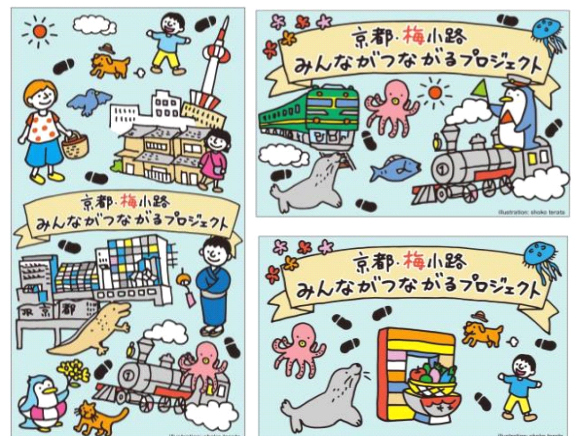
バナー・フラッグデザイン