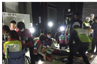
負傷者対応の様子（北館）