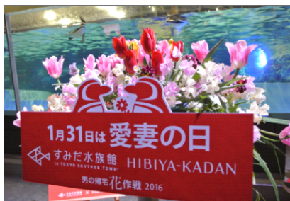
特設ステージ(昨年の様子)