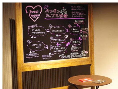
ペンギンカップル診断 昨年の様子

開催日：2017年1月28日(土)～3月14日(火) 開催時間：9時00分～21時00分 開催場所：すみだステージ 開催内容：日比谷花壇の花で華やかに装飾されたオリジナルの「ペンギンカップル診断」を設置します。「ペンギンカップル診断」では、カップルにちなんだ質問に答え、お客さまと似た『すみだ水族館』のペンギンカップルのタイプを診断しお楽しみいただけます。