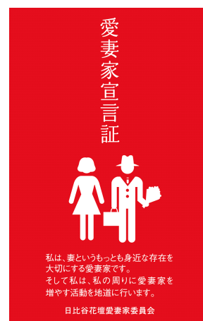
日比谷花壇特製 愛妻家宣言証

「愛妻家宣言証」は、“私は、妻というもっとも身近な存在を大切にする愛妻家です”という宣言付きの名刺サイズのカードで、宣言証の裏には、愛妻家として忘れてはいけない“奥さまの誕生日”、“結婚記念日”、“お二人だけの記念日”を書き込めるようになっています。“いい夫婦の日(11/22)”、“愛妻の日(1/31)”、“バレンタインデー(2/14)”と合わせて、これら6つの記念日の前後1週間以内に、全国の日比谷花壇店舗（一部店舗除く）にこの「愛妻家宣言証」を提示すると、商品が10%割引になります。割引特典は、2018年1月31日まで有効で、割引対象は、店頭持ち帰り商品となります。（※カタログ商品、宅配商品は、愛妻家宣言証による割引の対象外となります。）