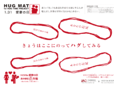
日本愛妻家協会×日比谷花壇 特製ハグマット