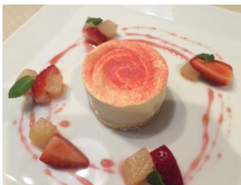
ローズティラミス イメージ

販売期間：2017年1月28日(土)～3月14日(火) 販売時間：9時00分～21時00分 ※各日限定10食 販売価格：800円(税込) 販売場所：5F ペンギンカフェ 商品内容：日比谷花壇の花を感じるスイーツ「ヒビヤカダンスイーツ」で使用されている香り高い希少な食用バラ「さ姫」のローズシロップを使い、皿の上に咲く一輪のバラをイメージして作ったティラミスです。女性の心をくすぐる、見た目も華麗な一皿となりました。