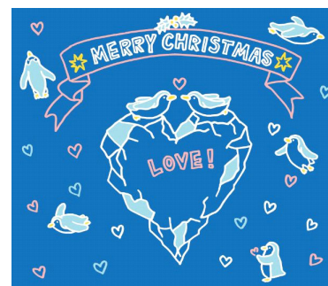
オリジナルフォトロケーション(イメージ)

ペンギンのようにペアになって一緒にミッションをクリアする体験プログラム。ハートやペンギンのモチーフがキュートなオリジナルフォトロケーションで寄り添って写真を撮ったり、魚を探したり、名前を呼び合ったりすれば恋のおまじないで二人の仲がより深まるかもしれません。