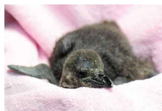
「ケープペンギン」の赤ちゃん

ハートやペンギンの装飾で賑わう館内で、水族館ならではのクリスマスの雰囲気をお楽しみいただけるイベントをぜひお楽しみください。