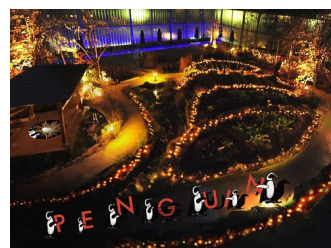
イルミネーション「PENGUIN CARNIVAL」