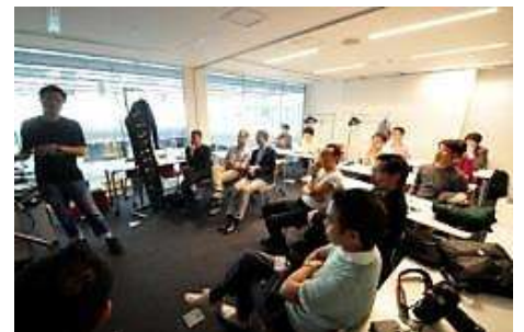
交流プログラムの様子