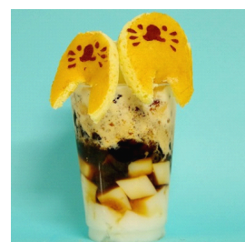
カップのふちに飾ったオットセイの赤ちゃんがキュートなパフェ