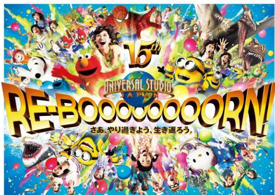
『ユニバーサル・スタジオ・ジャパンの15周年』

2016年7月1日(金)より15周年“やり過ぎの夏”がスタートします。世界に誇る少年マンガ誌を世界最高クオリティのアトラクションとして再現する「 ユニバーサル・ジャンプ・サマー 」が初開催。爆発的人気を集めた「妖怪ウォッチ」は、2大アトラクションをはじめ、パークまるごとで“リアル”な妖怪ウォッチの世界を満喫できる一大イベント「 ユニバーサル・妖怪ウォッチ・フェスティバル 」にスケールアップして登場。さらには、ミニオンがはちゃめちやを繰り広げるパークの夏恒例“水かけ祭り”「 ウォーター・RE-BOOOOOOOORN(リ・ボーン)・パーティー 」や「 ミニオン・クールタイム! 」など、15周年の“やり過ぎ”要素をふんだんに盛り込んだ夏ならではのコンテンツが登場。この夏、誰もが“RE-BOOOOOOOORN(リ・ボーン)”出来る場所として、日本を活気づけます。