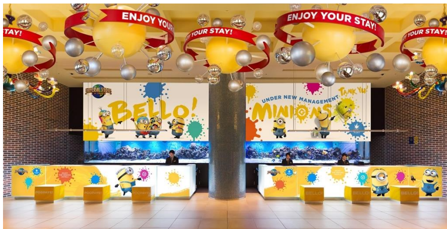
「ミニオン」のハチャメチャないたずらが今年もポートで楽しめる！（イメージ） ※実際のデザインと異なる場合があります

パークで大人気のミニオンたちが、オフィシャルホテル「ホテル ユニバーサル ポート」にも登場。ホテル内のデコレーションをお手伝い。だけど、やっぱり、イタズラ大好きなミニオンたちのこと、ロビーもエレベーターもハチャメチャなペイントに・・・!? おもしろおかしいミニオンの世界を、ホテルでもお楽しみいただけます。