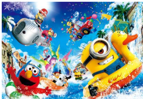
『ウォーター・RE-BOOOOOOOORN (リ・ボーン)・パーティー』 『ミニオン・クールタイム!』