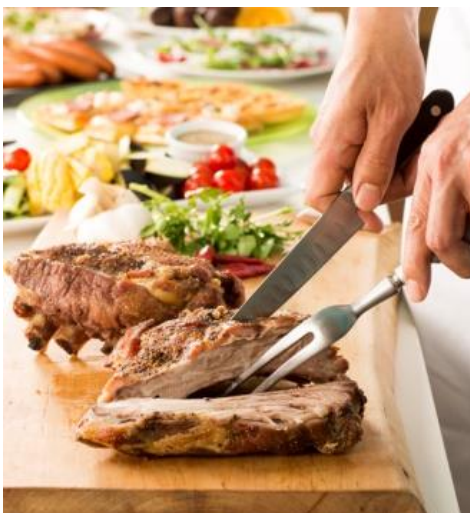
シェフが目の前で切り分ける「国産骨付き豚バラ肉のロースト」 豪快にカブリ！で一層「うまい！！」

飲 物 / アサヒスーパードライ、アサヒ黒生、スパークリングワイン(4種)、赤ワイン(4種)、白ワイン(4種)、 サングリア(赤・白)、フレーバードウイスキー(2種)、ウイスキー、ハイボール、カクテル、ビアカク テル、酎ハイ、焼酎、梅酒、ソフトドリンクなど40種類以上