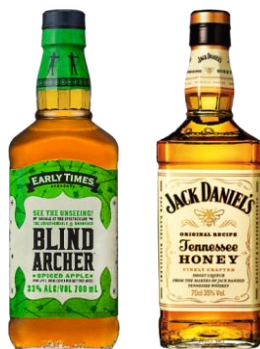
左「アーリータイムズ ブラインドアーチャー (青りんごフレーバー)」 右「ジャックダニエル テネシーハニー (はち みつ味)」

スパイスメニューでビールがすすむ！ 「トムヤムつけ麺」(左)と「ヤムニョムチキン」(右)は シェフのいちおし！