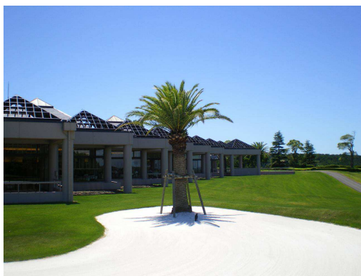
▲ クラブハウス外観（スタート側より）