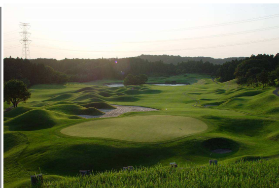
波打つマウンドが美しい9番ホール

"鬼才"ピート・ダイが日本で初めて設計したコースとして有名な「きみさらずGL」は、大きく波打つ独特のアンジュレーション、効果的に配置された池やバンカー、個性的なワングリーンなど、スタートから息つく間もなくスリリングな展開が続く18ホールのゴルフ場です。中でも17番ショートホール（パー3）は、アメリカPGAツアーの準メジャー大会開催コース「TPC ソーグラスプレーヤーズスタジアムコース」の17番ホールを模した浮島グリーンを採用し、「きみさらずGL」を代表するホールとなっています。このほかにも、月面のクレーターを彷彿させるマウンド群や背丈ほどの高さがあるポットバンカーなど、挑戦意欲をかきたてる個性的で美しいホールが続いています。