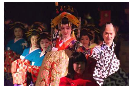
「花魁道中」イメージ