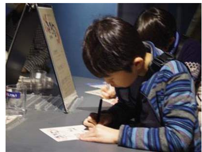
「魚魚合(ととまっち)」

展示内容：いきもの名前を楽しみながら学べるプログラムです。参加者は館内各所の「新春！もじもじ水槽」をヒントに、それぞれのいきものにマッチする漢字を探り当てます。