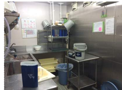
いきもののごはんを準備する「調餌室」