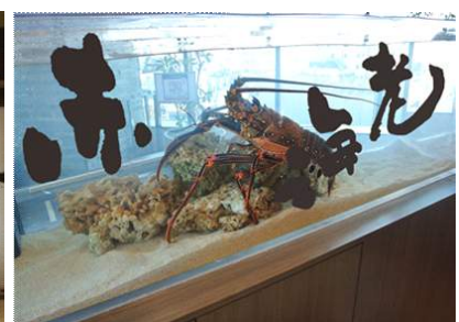
書といきものの融合展示 「新春!もじもじ水槽」