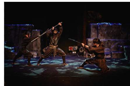
「忍者ショー」イメージ