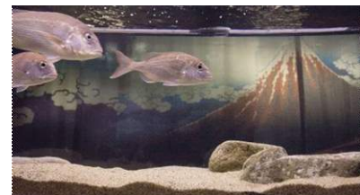
葛飾北斎の浮世絵とマダイ