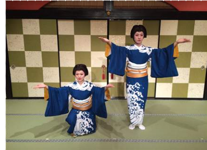
「祝いの舞」イメージ