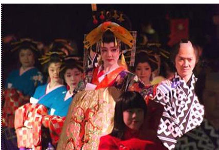
「花魁道中」イメージ

お正月の期間は、水族館ならではの縁起のよい展示やお正月遊びが楽しめる、『春遊び。ここは、お江戸の水族館。』に、ぜひお越しください。