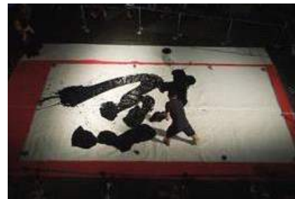
昨年の書道パフォーマンスの様子