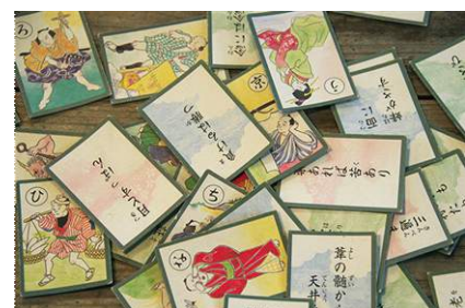
「お江戸のお正月遊び」イメージ

開催内容：江戸村ワンダーランドからやってきた「江戸人」たちと一緒に『おさかな福笑い』や『コマ回し』などの伝統的なお正月遊びを楽しめます。