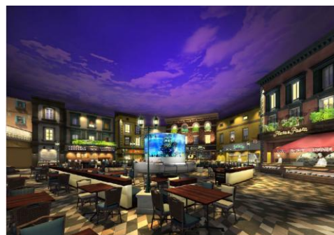
シーダパレス(夕景)