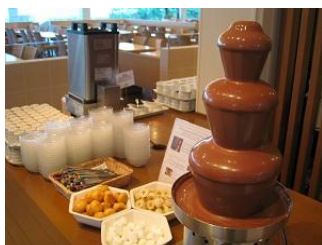
チョコレートファウンテン

ハンバーグ、グラタン、スパゲティ、カレー、フライドポテト、チョコレートファウンテン、ポップコーン、唐揚げ など