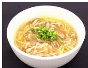
フカヒレラーメン