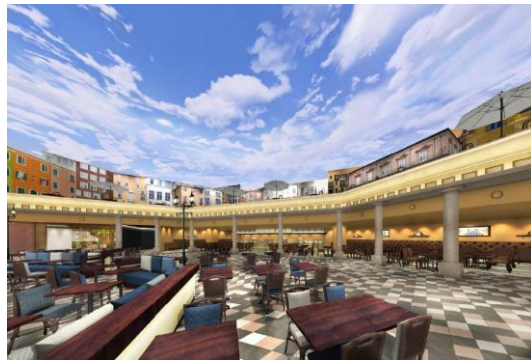
ナポリの広場をイメージした内装(昼景)