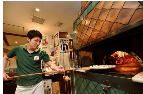
「ピッツェリア・ダ・ガエターノ」での研修風景