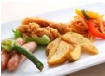
キッズコーナーメニュー