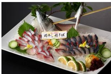
関さば、関あじのお造り

中津漁協より直送される新鮮な魚介類を中心に、関さばや関あじ、城下カレイ、豊後牛の炭火焼などを原価にてご提供いたします。