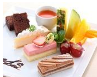
ケーキ・デザートコーナー メニュー

棚湯プリン、カリン&柚子のゼリー、マンゴープリン、ロールケーキ、スフレフロマージュ、ミルクレープ、さくらんぼとヨーグルトのムース、抹茶の生チョコ、モンブラン、シフォンケーキ、ハーゲンダッツアイスクリーム(バニラ、抹茶、ストロベリー)、大分県産フルーツ など