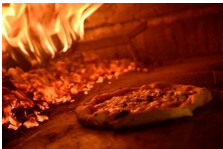
石窯で焼き上げるピッツァ

料理については、①本場イタリアから取り寄せた石窯を使用し、福岡にあるナポリピッツァの名店「PIZZERIA DA GAETANO(ピッツェリア・ダ・ガエターノ)」で修行した「杉乃井ホテル」の調理担当