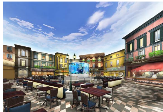
シーダパレス(昼景)

天井には、約 100 台もの照明器具を用い、LED 照明で時間帯によって昼、夕、夜景と色が変わる空を表現し、また、ムービングライトとゴボホイールを組み合わせ、風に吹かれて動く雲や夜空に輝く星を表現しています。室内にいながら、ナポリの街角で食事をするかのような開放感にあふれた空間を演出しました。