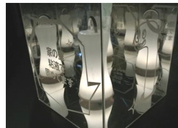
「チンアナゴのささやき」