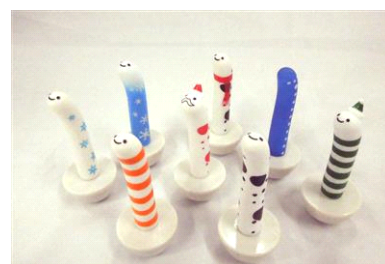
「きょうもゆらゆらチンアナゴ」

なお、当日17時以降に入場したお客さま先着1,111名には、合言葉「ゆらチン！」と引き換えにチンアナゴのフィギュア「きょうもゆらゆらチンアナゴ」をプレゼントします。