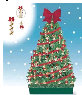
「チンアナゴツリー」イメージ

内容：ショップにいち早くクリスマスツリーが登場します。1,111個のチンアナゴやニシキアナゴのマスコットで装飾した高さ3メートルのここでしか見られないクリスマスツリーです。