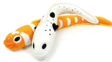
飼育員監修ぬいぐるみ

販売内容：すみだ水族館オリジナルの飼育員監修のぬいぐるみシリーズの新作です。模様の付き方からヒレの位置まで細部にこだわり抜いて仕上げました。