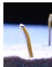
イエロー ガーデンイール