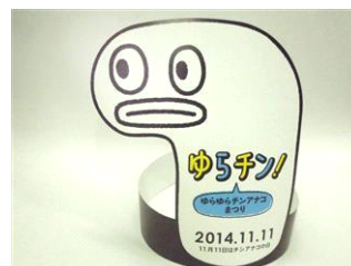
「お面 de チンアナゴ」※昨年度のデザイン