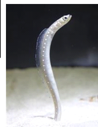
ホワイトスポッテッド ガーデンイール

ウナギ目アナゴ科の仲間。温暖で潮通しの良い砂地に生息。巣穴を掘って生活し、時には大きな群れを作る。日中は体を伸ばし流れにのってきた動物プランクトンを捕食する。