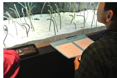
「チンアナゴのいただきます」