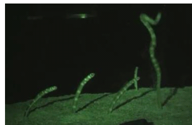
上映するニシキアナゴの産卵行動の動画