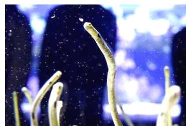
チンアナゴの晩ごはん「さあ、ごはん！」