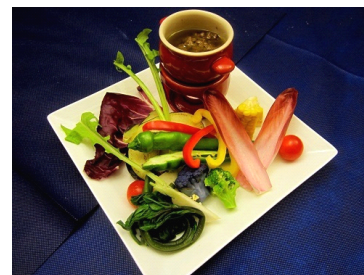
京野菜を使ったバーニャカウダ(イメージ)

夜は京の実りを感じることでできるアラカルトメニューをご用意し、京野菜を使用したバーニャカウダや肉盛りプレートなどスペシャルメニューを取り揃えています。