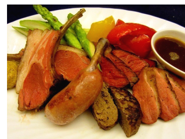
肉盛りプレート(イメージ)