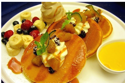
京野菜を使ったメニュー(イメージ)