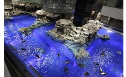
「ペンギンプール」(通常時・6Fから見た様子)