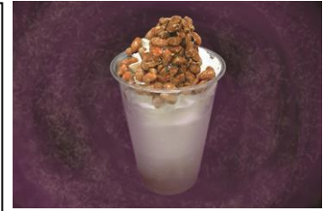
「ぬるぬる納豆シェーク」

販売内容：黒酢にオクラをトッピングしたところ天。その場でところ天突きで押し出して提供します。