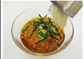
「にょろっところ天」