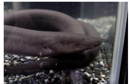
フタユビアンフューマ