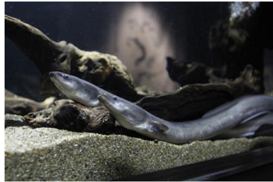
「ぬるによろすい」展示：ニホンウナギ

「ペンギン花火」は、日本最大級*の屋内開放型ペンギンプールの底面全体に、花火をイメージした映像をプロジェクションマッピングを用いて投影するショープログラムです。7月18日（土）の公開以降、カップルやご家族と一緒に楽しめる新しい夏の風物詩として多くのお客さまを魅了し、鮮やかな水中花火と愛らしいペンギンたちの共演は、テレビ、新聞、雑誌などで多数紹介されました。16時以降は、「ペンギン花火」の上映に合わせて、館内に「懐かしい花火大会」をイメージして調合したオリジナルアロマ「花流（かな）」が香り、より一層皆さまに夏の情緒を感じていただくことができます。