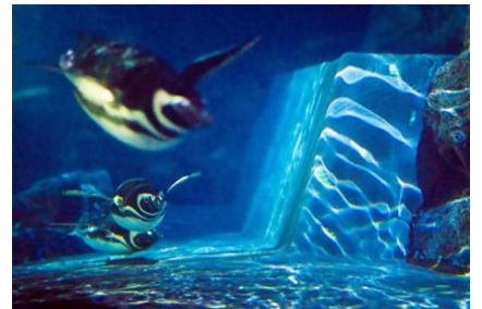
「ペンギン花火」(5Fから見た様子)