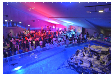
ペンギンプールの前で行う アーティストによるライブ

③飼育スタッフによるトークライブ「ペンギンライブ」 飼育スタッフだからこそわかるペンギンたちの個性や、さまざまな恋愛模様について解説します。