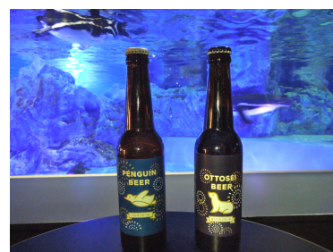
ペンギンビールとオットセイビール

販売期間：2015年8月5日(水)、6日(木)、7日(金) 20日(木)、21日(金) (全5日) 販売時間：各日19時00分～22時00分 販売価格：600円(税込) ※女性限定で、300円(税込)で販売します。 販売内容：墨田区で人気の地ビールメーカー「Virgo Beer (ヴィルゴビール)」とコラボレーションし、『すみだ水族館』オリジナルのクラフトビールを販売します。ぜひ、ビールを片手に夜の水族館をお楽しみください。