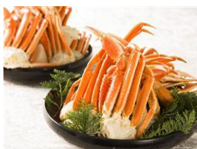
水曜日:ポイルずわい蟹