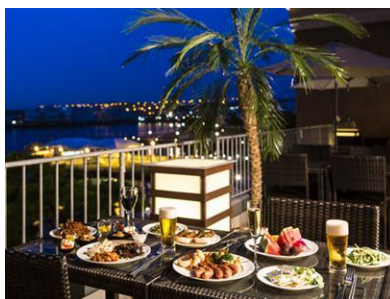
ハーバーサイドの夜風が心地よいテラス席