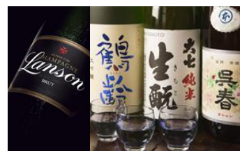
土曜日:シャンパン&日本酒が フリードリンクにプラス