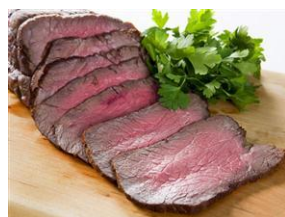
木曜日:国産牛もも肉の ローストビーフ