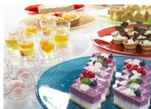
金曜日:16種類のスイーツ &デザート