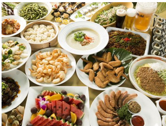
ビールが一層美味しくなる多彩なお料理