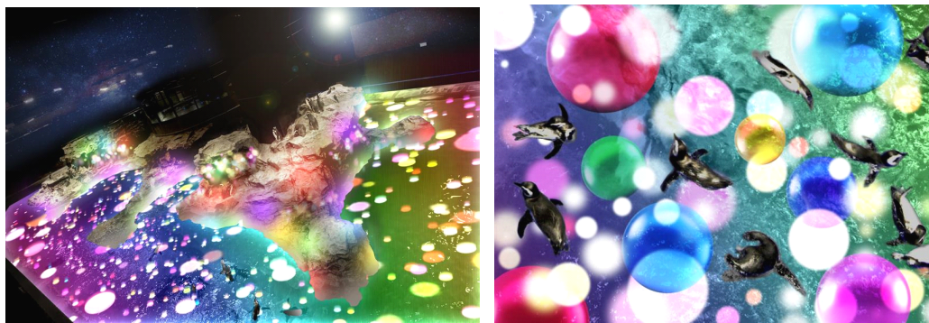
幅24メートルの日本最大級のペンギンプールを5,000のキャンディカラーの光で満たす プロジェクションマッピング『Penguin Candy』

さらに、1日4回開催する「Penguin Candy」は、映像と音楽を使用した特別なコンテンツです。映像の終盤では5,000のポップでカラフルなキャンディを模した光の演出でペンギンプールを満たします。ペンギンたちの好奇心を刺激し、お客さまにも楽しんでいただける10分間のプログラムです。