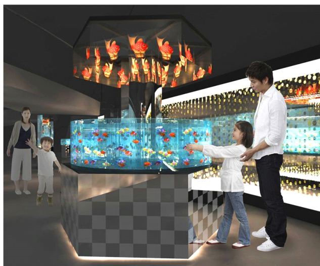
江戸時代より人々に愛されている金魚などの約2,000匹の水生生物を展示する 『Edorium』

展示名称 : 『Edorium(エドリウム)』 展示期間 : 2015年4月25日(土) オープン 展示時間 : 終日展示 展示生物 : 金魚(ランチュウ、エドニシキ、ワキン) (予定) アナゴ、ナマズ、ドジョウ 展示内容 : 2メートルの円柱水槽で展示するワキンなど約2,000匹の水生生物を展示する新ゾーンです。「雅」と「粋」をテーマとした二つの異なるエリアで構成するこのゾーンは、懐かしくも新しい新しい水族館での体験をご提供します。日本が誇る江戸文化を水族館として表現した、新感覚のゾーンです。