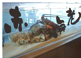
『魚魚初め(ととぞめ)』

名 称：魚魚初め(ととぞめ) 開催期間：2014年12月27日(土)～2015年2月1日(日) 開催場所：館内各所 参加方法：当日受け付け 開催内容：期間中、展示している13種類のいきもの水槽に マエダカマリ氏が書いた漢字を展示します。エント ランスで配布するカードに自分が好きな漢字を書い て投票します。「人鳥(ペンギン)」「水海月(ミズ クラゲ)」など、普段見慣れたいきもの名前も 漢字で表現すると新たな発見があるはずです。