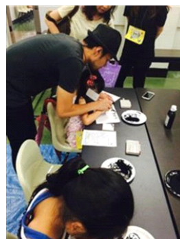
『念い書き(おもいがき)』

名 称：水槽のある空間で大切な人へメッセージを書こう ～念い書き(おもいがき)～ 開 催 日：①2015年1月6日(火) ②2015年1月7日(水) 開催時間：①15時00分～15時40分、16時00分～16時40分 17時00分～17時40分 ②15時00分～15時40分、16時00分～16時40分 開催場所：すみだステージ 参加方法：事前募集 ※公式ホームページで募集 募集期間：2014年12月22日(月)～12月30日(火) 参加料金：無料 ※入場料別途 参加対象：親子 参加定員：各回10組20名 ※応募者多数の場合は抽選 開催内容：お正月の風物詩である書初めを、書家・マエダカマリ氏と一緒に親子で参加して行います。