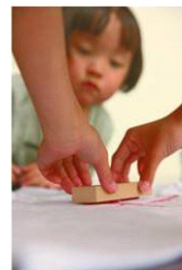
『北斎Tシャツ』 ※イメージ