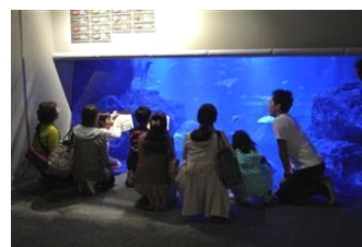
『飼育員のおさかなツアー』

名 称：飼育員のおさかなツアー 開 催 日：2015年1月10日(土)、17日(土) 24日(土)、31日(土) 全5回 開催時間：各日17時30分～18時00分 開催場所：館内各所 参加料金：無料 ※入場料別途 参加対象：小学3年生以上 参加方法：事前募集 ※公式ホームページで募集 募集期間：(1月10日、17日分)12月22日(月)～12月29日(月) (1月24日、31日分)12月22日(月)～1月14日(金) 参加定員：各回6名 ※応募者多数の場合は抽選 開催内容：飼育スタッフと一緒にいきものを観察します。 葛飾北斎の作品といきものの特徴などを解説します。