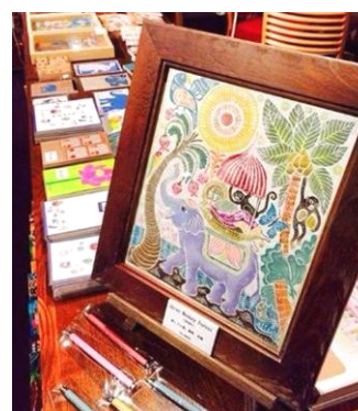
消しゴム版画作品 一例 「Jalan Monkey Forest」