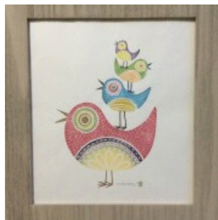
消しゴム版画作品 一例「Tori Dori 01」