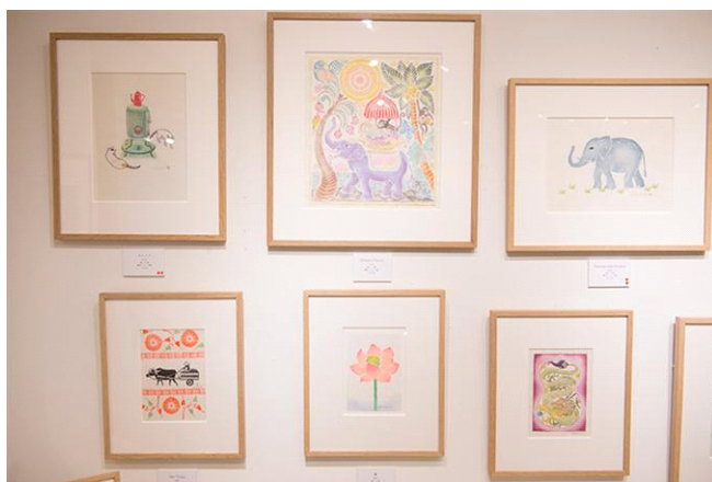
消しゴム版画展示イメージ