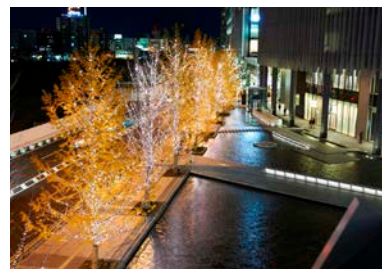
グランフロント大阪イルミネーション昨年開催時の様子