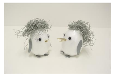
たちあがれ！ペンギン

開催内容：ペンギンの卵と同じ大きさの発泡スチロールに、目玉やくちばしフリッパーを貼り付けてかわいいペンギンの赤ちゃんを作ろう。指でつつくと、揺れながら立ち上がります。