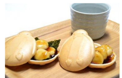
ペンギンモーニング

販売期間：期間中の平日(月曜日～金曜日) 販売時間：9時00分～11時00分 販売場所：5階 ペンギンカフェ 販売価格：100円(税込み) 商品内容：ペンギンの誕生を記念して、平日限定のモーニングセットを販売 します。ペンギンモナカに包まれた、「磯部焼き」または「みたら し団子」のどちらかと、ドリンクのセットで100円というお得な メニューです。