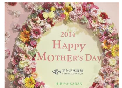
フラワーメッセージ