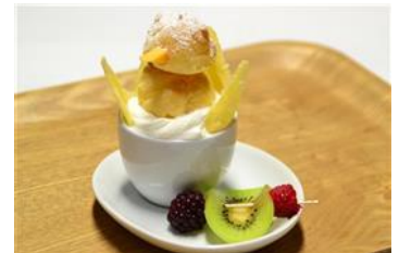
Happy Penguin Pudding

販売期間：2014年5月3日(土・祝)～6月30日(月) 販売場所：5階 ペンギンカフェ 販売価格：350円(税込み) 商品内容：雛が卵から孵った感動を再現したプリンです。濃厚な卵プリン の上に、ミニシュークリームで作ったふわふわでポツリかわ いいペンギンをのせました。