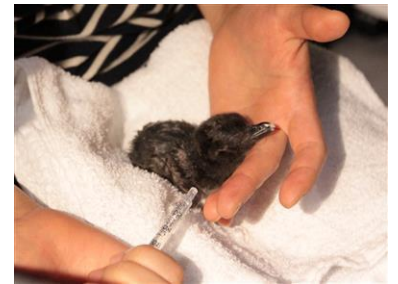
誕生した赤ちゃん