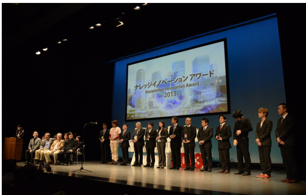
「Knowledge Innovation Award」授賞式の様子