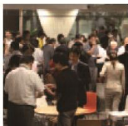
サロン会員パーティ

プロジェクトルーム プレゼンテーションや会議のできる個室スペース。プレゼンテーションのための設備も完備しています。