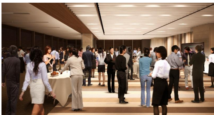
100名規模のイベントにも対応できるイベントスペース (イメージ)

ベンチャーに限らず大手企業の会員の方からも、交流のきっかけを創出するための自己の活動を発表できる場を求める声にお応えし、“表現の場”の機能を付加します。プレゼンラウンジの中心にホワイトボードや展示パネルとしても利用できる可動式間仕切りを設置します。これにより、複数箇所でのプレゼンテーションやディスカッションができ、30人、60人規模のスペースに分割してセミナーやワークショップなどの活動も可能となります。