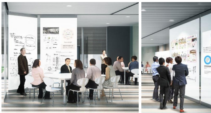
ホワイトボードや展示パネルを活用したプレゼンテーションスペース (イメージ)

「コラボレーションから新たなプロジェクトの創出」を目指し、“表現の場”としての機能をもつ「プレゼンラウンジ」を新たにご提供します。自己の活動を発表するプレゼンテーションや、情報発信し交流を促進するイベント利用など、充分なスペースを追加しナレッジサロンでの活動を活性化させます。