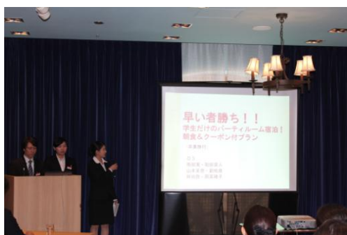
2013年12月6日最終プレゼンの様子