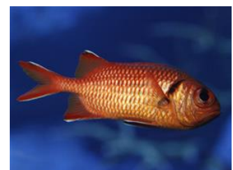
夜行性のアカマツカサ

毎日18時から実施している、普段なかなか見られない、いきものの夜の生態を観察することができるイベント。日中よりも暗くなった東京大水槽で、夜行性のいきものが餌を求めて動き出す姿など、いきものたちの夜の生態をご覧いただくことができます。