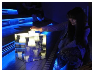
ミラーボックスのイメージ

<本件に関するお問い合わせ先> すみだ水族館 広報室/村木・久我 ■TEL:03-5619-1284 ■MAIL: press-sumida@orix-aqua.co.jp