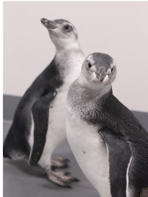
「まつり」と「はなび」(8月11日撮影)

現在、2羽の赤ちゃんはバックヤードやペンギンプールで、泳ぎの練習や群れに加わるトレーニングを重ねています。徐々に飼育スタッフから離れて泳ぐなど、仲間のペンギンにも受け入れられつつあり、9月1日(日)にはバックヤードからペンギンプールに移り、展示を開始する予定です。2羽の赤ちゃんは「亜成鳥」という段階で、成鳥とは異なる羽で全身が覆われています。今後、仲間のペンギンと暮らしていく2羽の赤ちゃんペンギンの様子を、ぜひご覧ください。