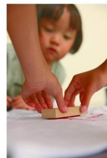
スタンプのイメージ