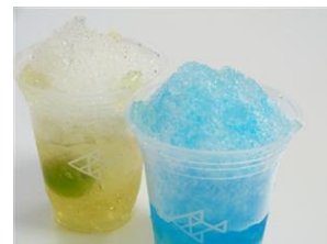
シャリシャリ和カクテル2種

内容：カキ氷に梅酒や国産焼酎ベースのシロップをかけた暑い夏にぴったりのカクテルです。