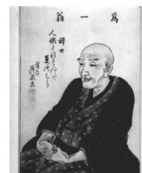
北斎肖像画 溪斎英泉画

葛飾北斎の「葛飾」は、出生地である「すみだ」を含む地域が、武蔵国葛飾郡であったことから名乗ったと言われます。