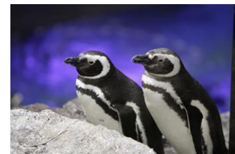
カリンとカクテル