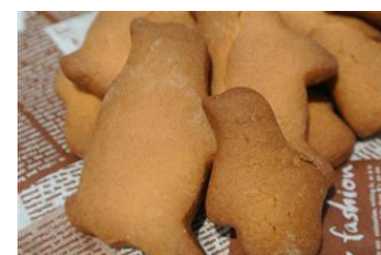
ペンギン親子クッキー