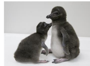
生まれた2羽の赤ちゃん