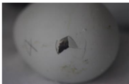
嘴打ちが始まった卵

生まれたばかりの赤ちゃんは、現在体長15センチほどですが、1ヶ月程で成鳥(体長50~60センチ)とほぼ変わらない大きさまで成長します。この時期にしか見ることができない生後間もないかわいいペンギンの赤ちゃんの様子と、赤ちゃんを見守る飼育スタッフの愛情をぜひご覧ください。