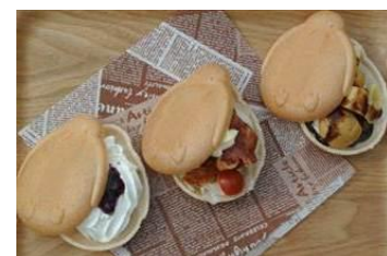
ペンギンベビーサンド3種

内容：①ベビーチーズのブルーベリーホイップサンド ②ベビートマトのBLTサンド ③ベビージュースのバナナチョコサンド