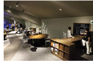
ペンギンアカデミー