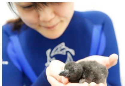
誕生後1日目の赤ちゃん