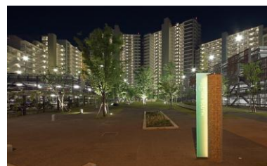
「セントラルガーデン」