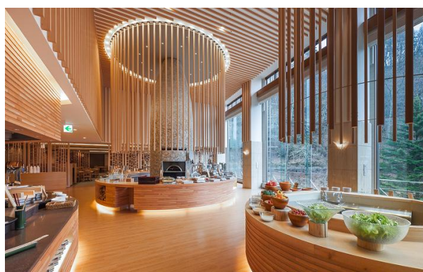
バイキングレストラン「Seeds(シーズ)」

「蓼科グランドホテル滝の湯」は、創業 88 年の歴史を持つ老舗旅館であり、天皇陛下が皇太子時代に 4 度ご宿泊された由緒ある温泉旅館です。オリックス不動産は、2011 年 9 月に運営を開始し、2012 年 4 月にバイキングレストラン、エントランス、ロビーラウンジを中心にリニューアルを行いました。