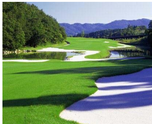
▲ 美しく戦略性の高いコース

「御嵩工房」は、御嵩花トピア C のスタートテラスにあるスイングチェックコーナーを改修しオープンするもので、従来クラブハウス内のプロショップで行っていたグリップ交換に加え、新たにクラブ無料診断を開始いたします。